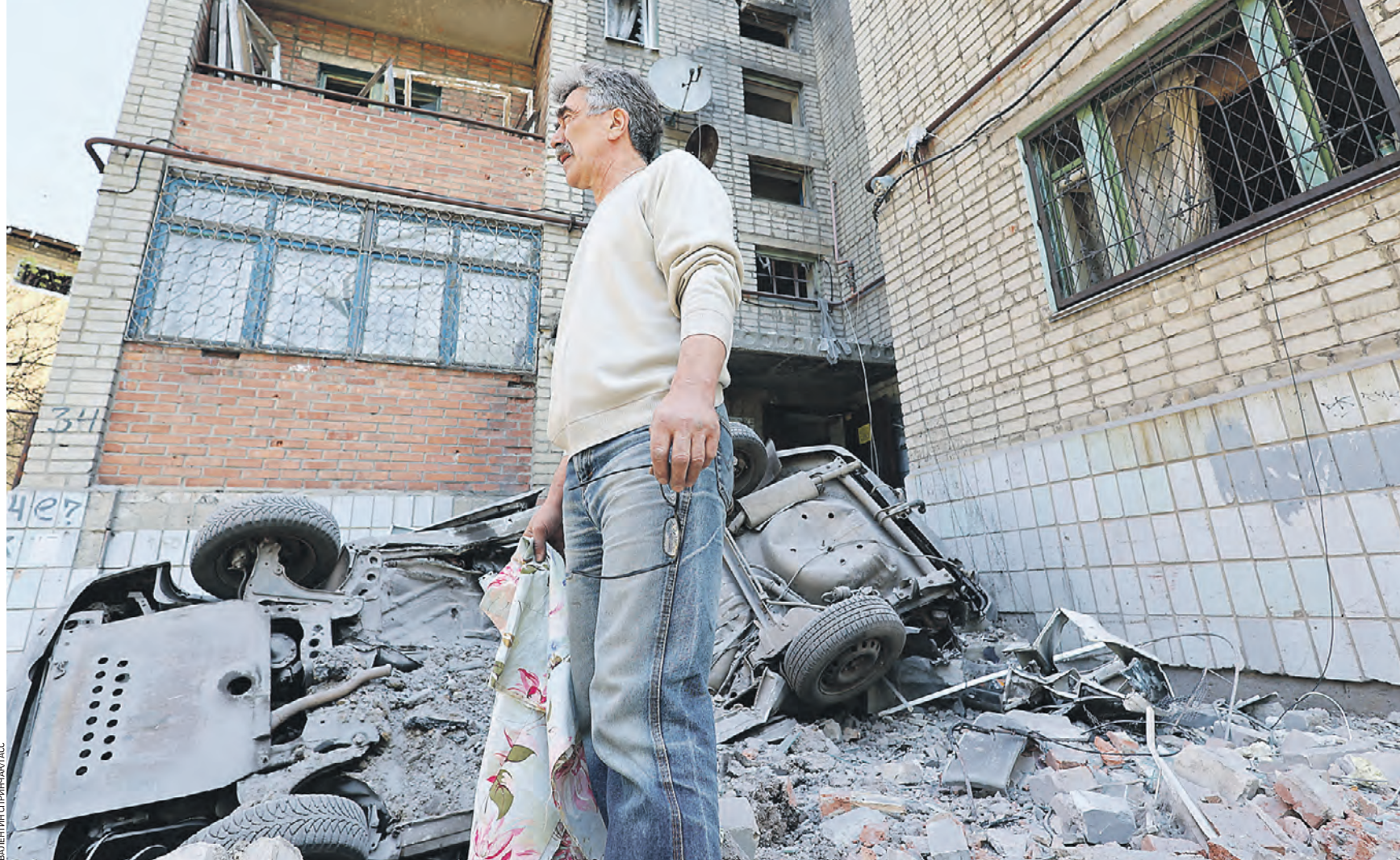
15 мая 2023 года. Житель города Ясиновата возле автомобиля, поврежденного в результате обстрела со стороны вооруженных сил Украины. Боевики киевского режима несколько дней выпускают по населенному пункту снаряды, разрушая дома и социальные объекты

А вот в районе Артемовска, наоборот, наши солдаты занимают более выгодные рубежи. Это становится возможным в результате наступательных действий подразделений Воздушно-десантных