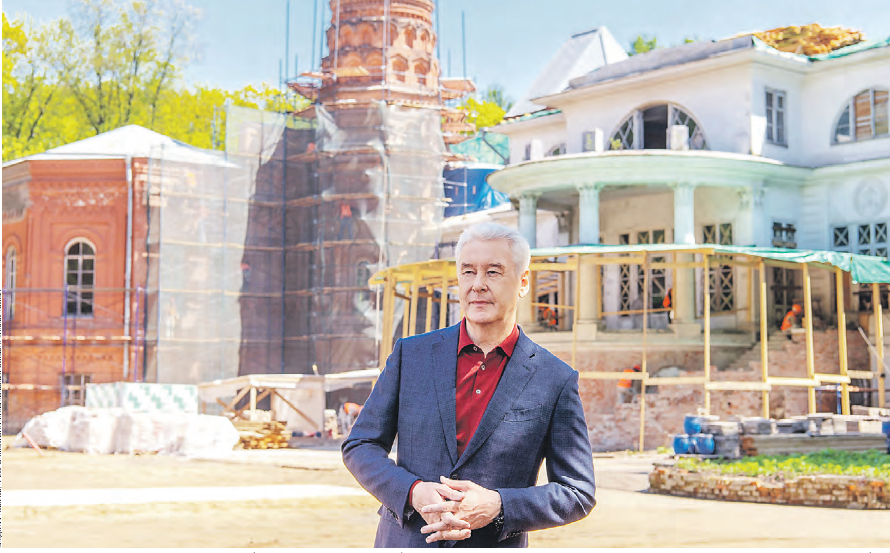
21 мая 2022 года. Мэр Москвы Сергей Собянин осмотрел, как идет реабилитация парка «Покровское-Стрешнево». Это один из этапов возрождения старинной усадьбы. Уникальный памятник архитектуры XVIII–XIX веков дошел до наших дней в плачевном состоянии. Но реставраторы вернут ему былое величие

— Уникальный памятник архитектуры XVIII–XIX веков дошел до наших дней в плачевном состоянии, — написал Сергей Собянин. — Начиная с 1981 года усадьба переходила из рук в руки, какое-то время была бесхозной, пережила несколько пожаров. Но теперь по архивным фотографиям и чертежам старинным постройкам вернуть первоначальный вид. Реставрация идет полным ходом. В главном доме уже привели в порядок фасады кирпичных пристроек. По центру воссоздали полуциркульные белокаменные лестницы, лепной декор и окна. Крышу покрыли медью. — Еще предстоит смонтировать водосточную систему, установить ограждения на