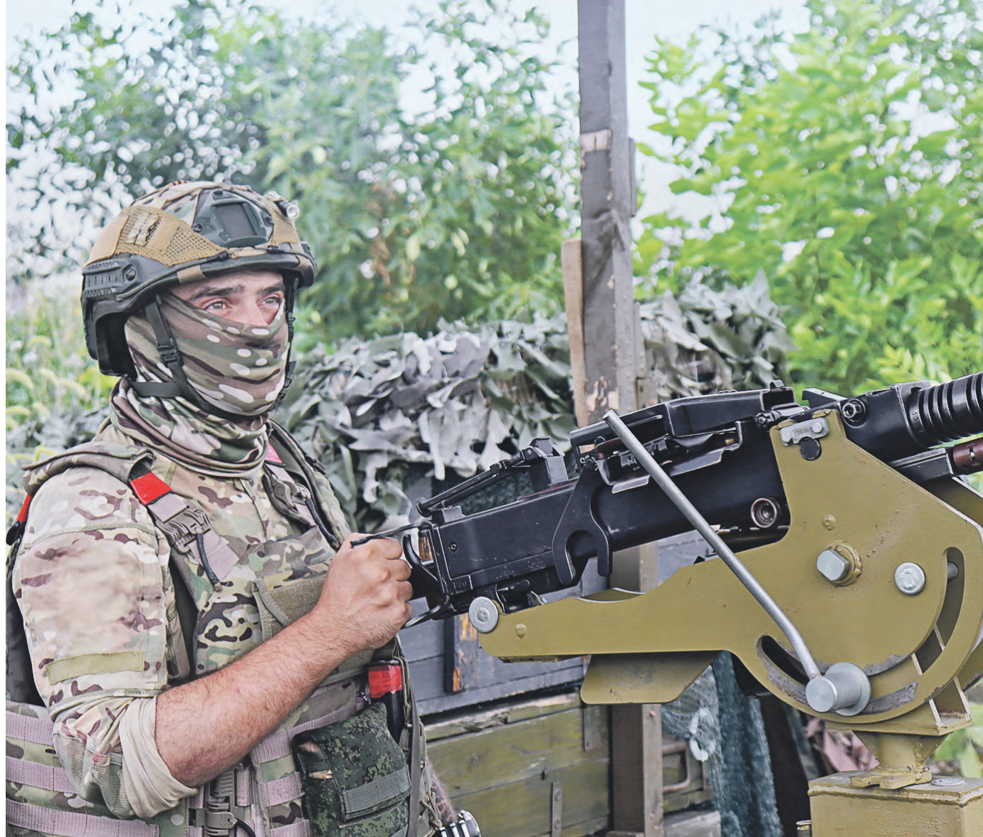
20 июля. Боец с позывным «Алекс» несет службу на пункте воздушного наблюдения.

По его словам, лучше всего сбивать дроны из автомата, используя механический прицел. Любая оптика ограничивает обзор, а это очень опасно, особенно когда дронов несколько — один из них может облететь сбоку. С «открытым» прицелом это спокойно можно заметить. Также, для того чтобы уничтожить «птичку» противника, иногда хватает одной пули, а в других случаях 300 патронов мало. Все зависит от опыта оператора противника. — Если операторы опытные, то 90 процентов, что дрон уйдет. Когда мы его засекаем и начинаем вести, то видим подразделение, запущившее аппарат, и даже позывной оператора. То есть мы уже зна-