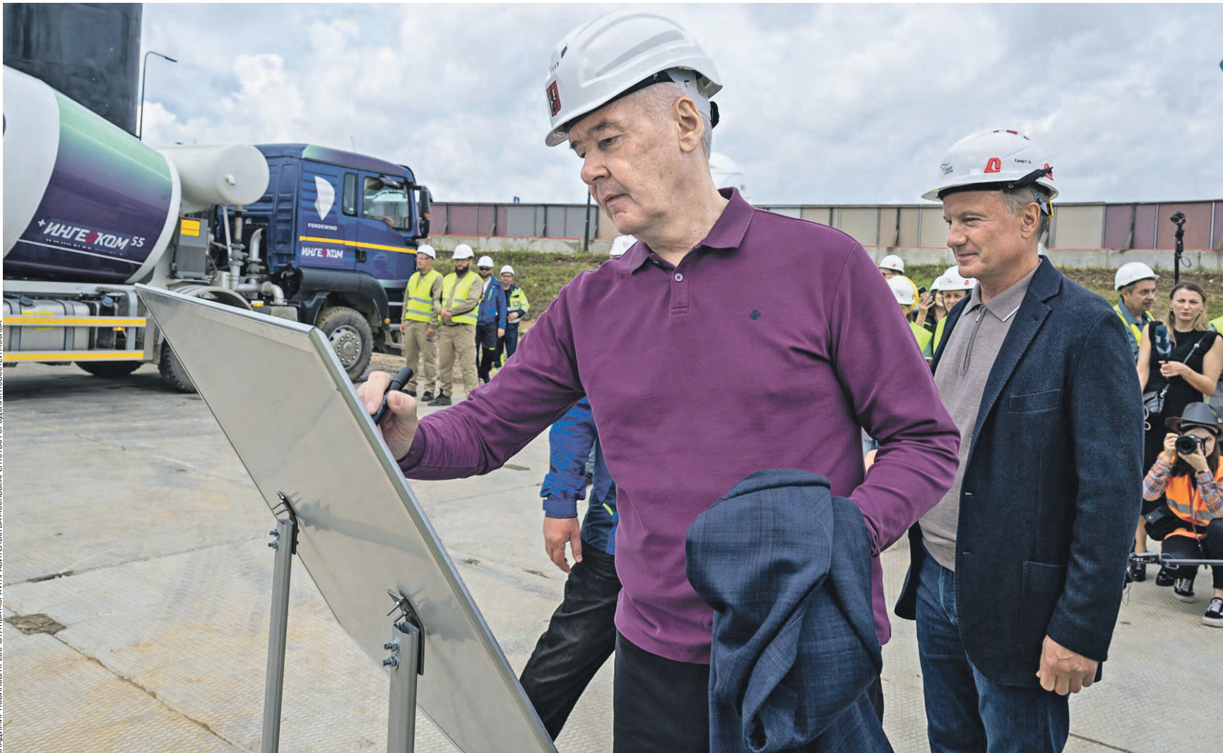
19 июля, Мэр Москвы Сергей Собянин (на переднем плане) и президент, председатель правления «Сбербанка России» Герман Греф расписались на карте, где отмечен будущий микрорайон «СберСити». Историческое событие состоялось на месте, где построят станцию метро «Рублево-Архангельское»

Уникальный проект В Рублево-Архангельском наряду с жилыми домами построят деловые центры, в которых будут работать 70 тысяч человек. Новый микрорайон обеспечит всей необходимой