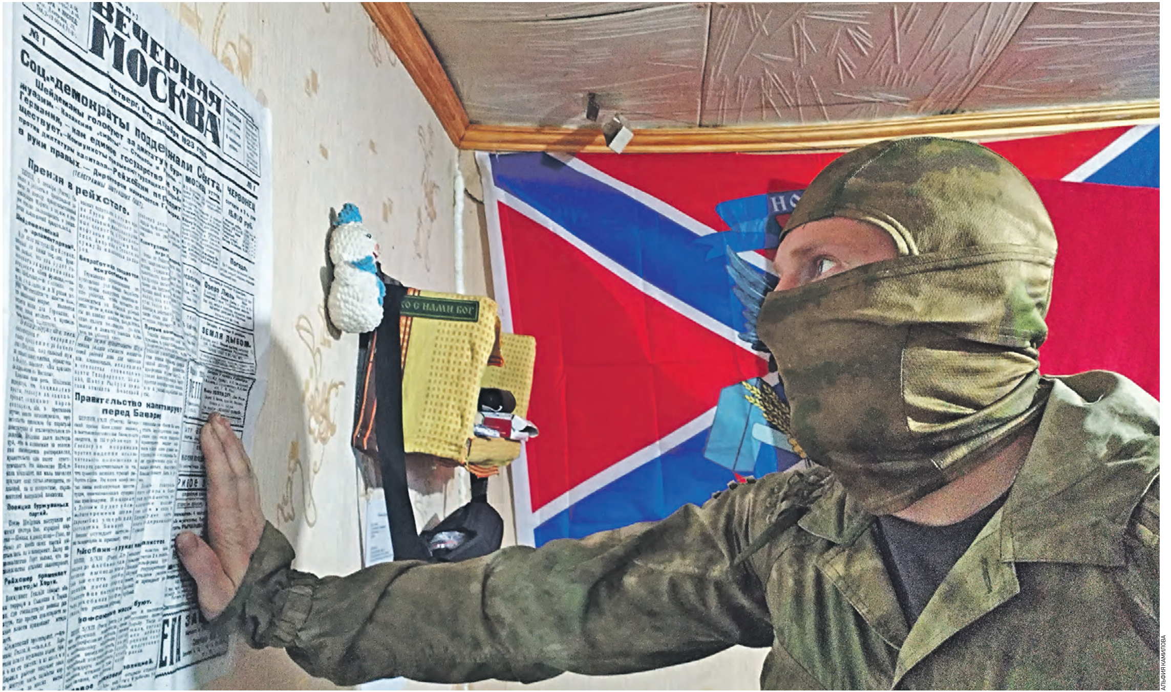
Самое ценное — игрушки и рисунки от малышей, открытки и письма от школьников и пенсионеров — вывешивают на стены блиндажей. Теперь здесь висит и копия первого номера «Вечерней Москвы» от 6 декабря 1923 года