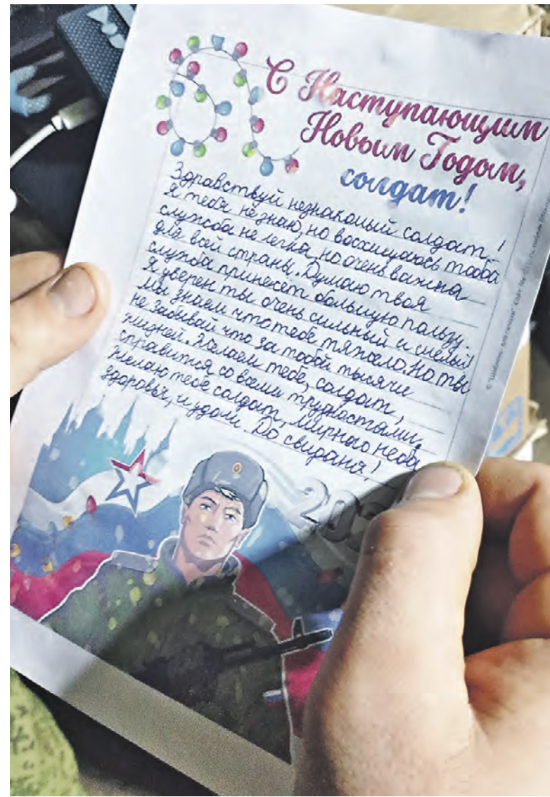
Самые трогательные — письма от детей. Их бойцы читают в первую очередь