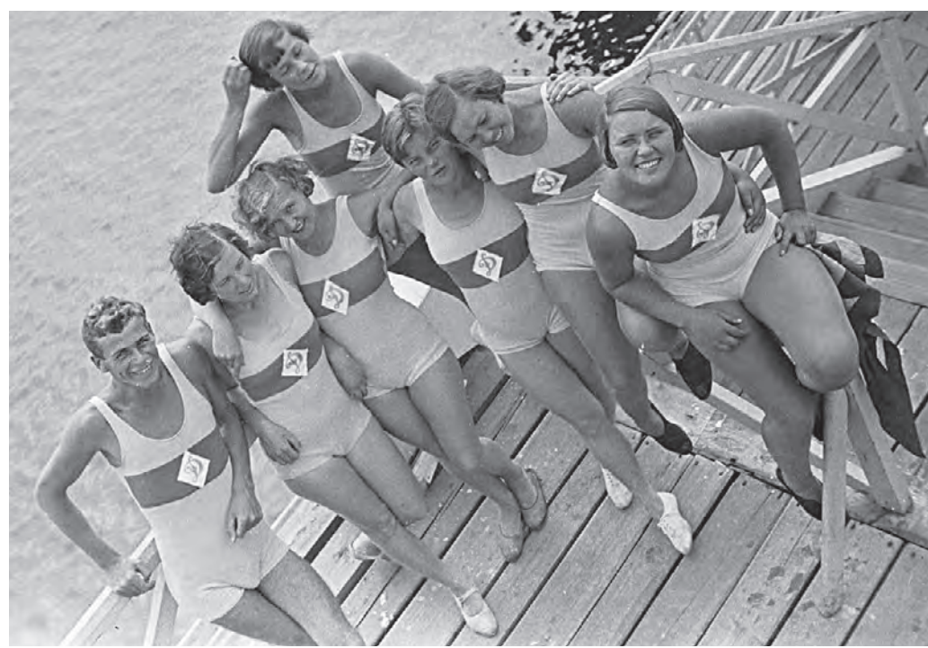
1932 год. Спортсмены общества «Динамо» на водной станции.

Вчера в культурном центре «Зотов» состоялась открытие экспозиции, посвященной 100-летию юбилею Всероссийского физкультурно-спортивного общества «Динамо».