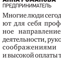
АННА РОМАНОВА предприниматель

чаще возникают проблемы в силу тех или иных обстоятельств. Например, к сожалению, бывает недостаточно компетентны для выполнения тех или иных задач. Например, не все из них умеют ездить на погрузчике. Поэтому приходится тратить время, силы и финансы на их обучение, что не всегда и не все работодатели могут себе позволить. Кроме того, часто препятствием в общении с ними становится языковой барьер, потому что многие из мигрантов говорят на русском языке на недостаточно высоком уровне. Это тоже не упрощает задачу.