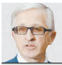
АЛЕКСАНДР ШОХИН ПРЕЗИДЕНТ РСПП

Также ожидаются подведения итогов 28-й климатической конференции ООН, которая прошла в Дубае. Будут формироваться базовые принципы развития российского углеродного рынка. Ключевая тема, которая также будет вынесена на обсуждение во время Недели российского бизнеса — контрольно-надзорная разрешительная деятельность. Из нетрадиционных направлений затронуты тема майнинга и криптовалюты. Сам съезд промышленников и предпринимателей стартует в первой половине апреля, после выборов президента. В рамках съезда будут определены победители в области предпринимательской деятельности для крупных российских компаний. Компаний-лауреатов награждают премией под названием «Лидеры ответственного бизнеса». Одна из сквозных тем нашего международного форума это — Евразийская интеграция. Традиционно на наших мероприятиях всегда присутствует руководители организации иностранного бизнеса и другие зарубежные главы компаний. Их ассоциации — это часть российского бизнеса. Однако форум в основном посвящен тому, как продвигать российские компании за рубежом.