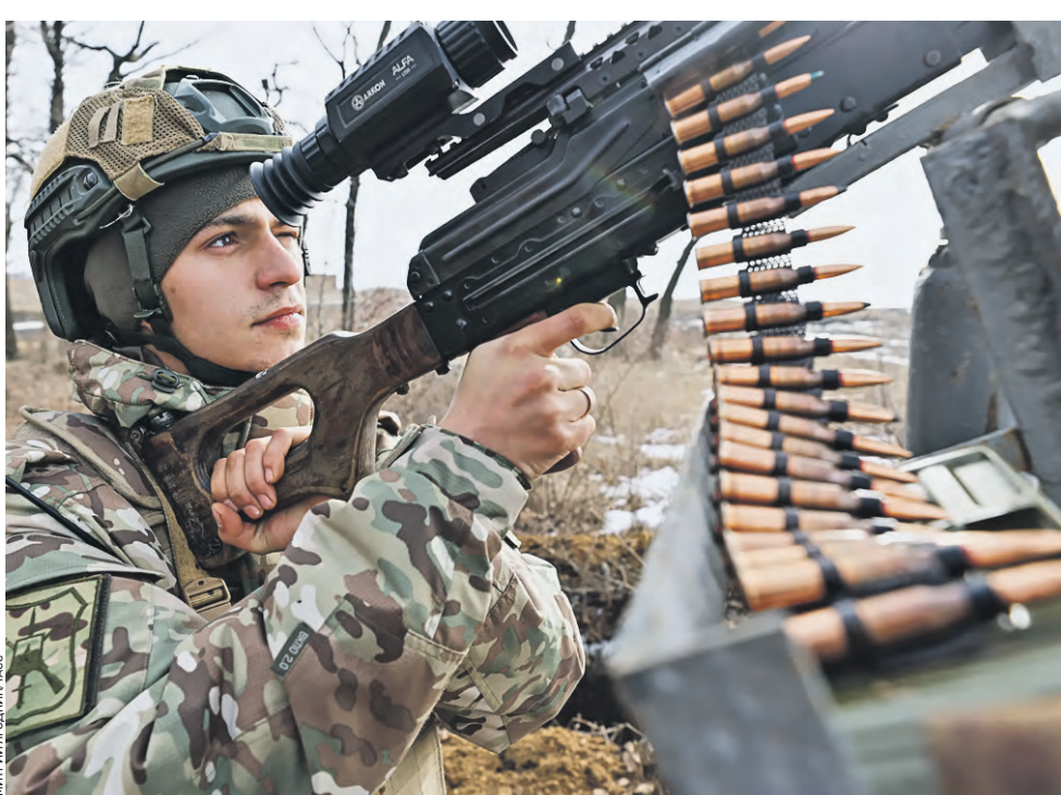
4 февраля. Военнослужащий 132-й отдельной мотострелковой бригады (ОМСБр) во время боевых учений на полигоне в ДНР. Инструкторы обучают мотострелков штурмовать опорные пункты ВСУ. Все навыки бойцы оттачивают до автоматизма. Как уточнили в Минобороны, на полигонах происходит интенсивный обмен знаниями и навыками. Инструкторы прислушиваются к ребятам с боевым опытом, анализируют успешные решения и интегрируют их в программу обучения.