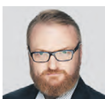
ВИТАЛИЙ МИЛОНОВ ДЕПУТАТ ГОСУДМУ

Четверть мужчин готовы заниматься бытом и не работать. И как вам?