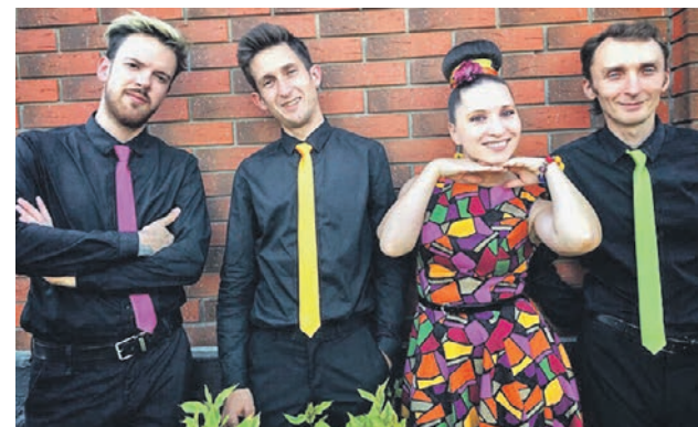
Музыкальный коллектив «Бригада TESS» придает современное звучание ретрохитам