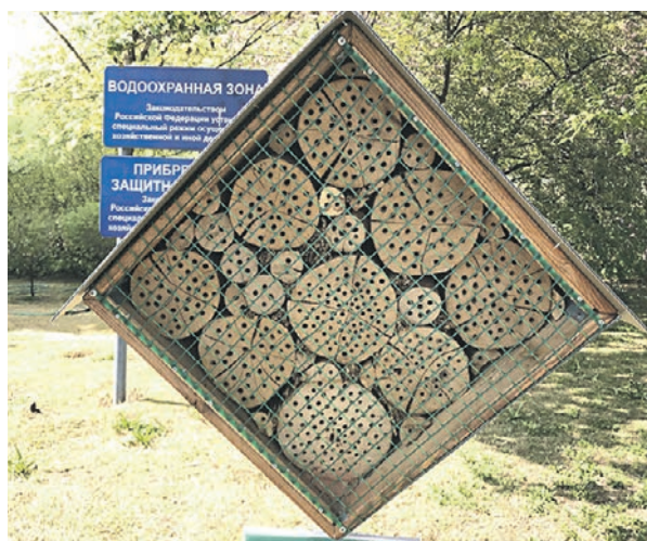
Пчелиный дом, установленный недалеко от павильона «Птицы и бабочки» в зоопарке