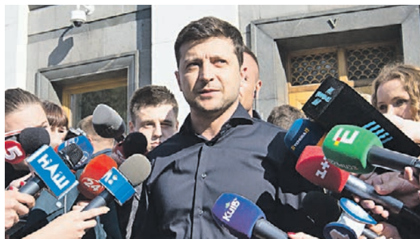
4 мая. Избранный президент Украины Владимир Зеленский во время брифинга

■ Инаугурацию избранного президента Украины Владимира Зеленского просят перенести из-за неблагоприятной астрологической даты. Депутат Верховной рады Олег Куприенко, выступающий от Радикальной партии, заявил, что он против даты проведения инаугурации избранного президента Украины Владимира Зеленского. Он объяснил, что на 19 мая выпадает так называемое гнилое воскресенье. — 19 мая — это первый день третьей недели месяца, так называемое гнилое воскресенье, когда ничего нельзя начинать, — сказал депутат.