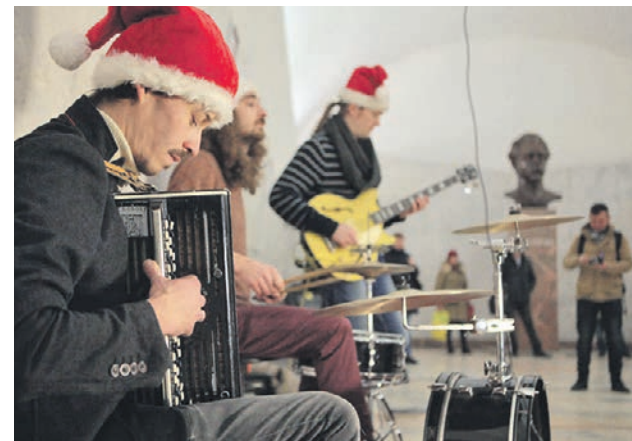
Группа «Дремучий случай» выступает в метро в один из предновогодних дней