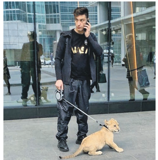
Мужчина выгуливает на поводке львенка на улицах Москвы. Это вызывает споры и возмущения

Сейчас содержание таких животных не регламентируется. Но поправки к Закону «О ветеринарии» уже рассматриваются. После принятия этих поправок россиянам запретят содержать диких и опасных животных. Тем, кто уже завел дикого питомца, придется их регистрировать. Для нарушителей будет введена административная ответственность вплоть до изъятия.