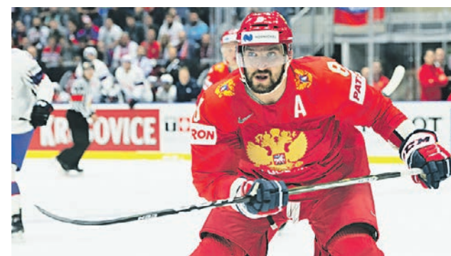
10 мая 2019 года. Александр Овечкин во время матча чемпионата мира по хоккею — 2019 между сборными России и Норвегии

Александр Овечкин — первый русский капитан, поднявший над головой Кубок Стэнли и второй русский, ставший самым ценным игроком в плей-офф. Из чаши трофея хоккеист ел черную икру, отмечая завоевание престижной награды.