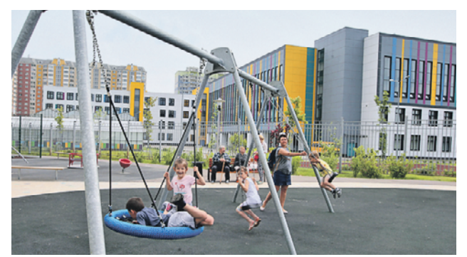
24 мая 2019 года. На присоединенных территориях активно строят новые школы