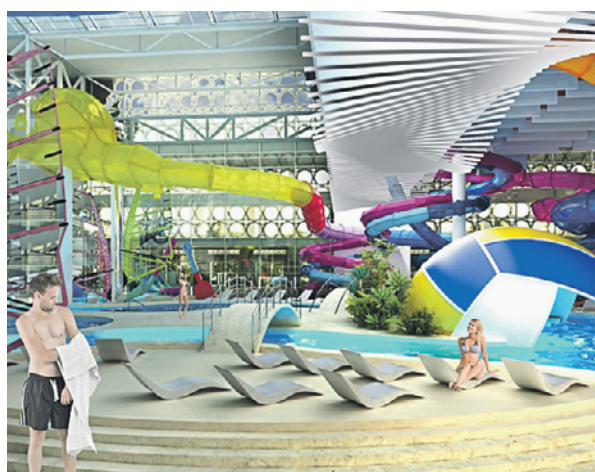
Проект аквакомплекса, который откроется на территории «Лужников»