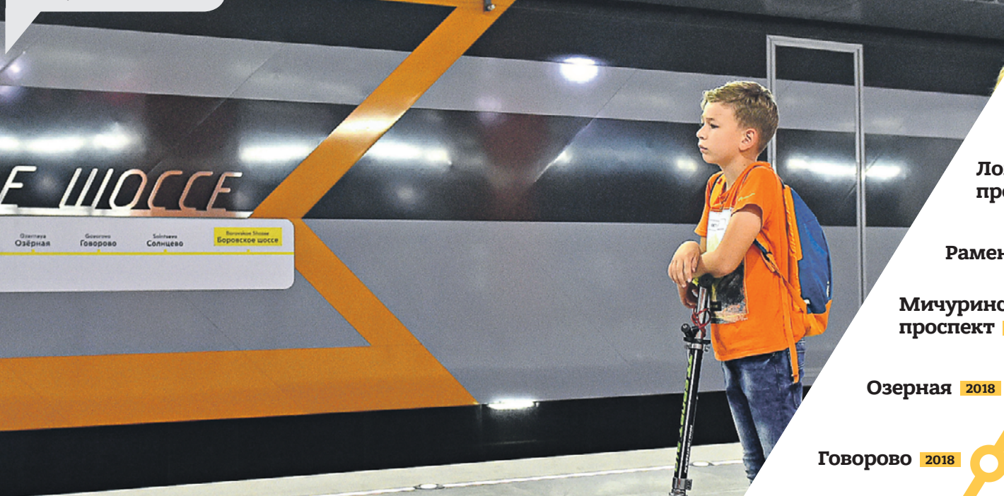
Озёрная Озёрная Говорово Солнцево Боровское шоссе

Образ этого подземного сооружения — «наземный», потому что станцию метро архитекторы решили отождествить с одной из главных транспортных артерий — Боровским шоссе.