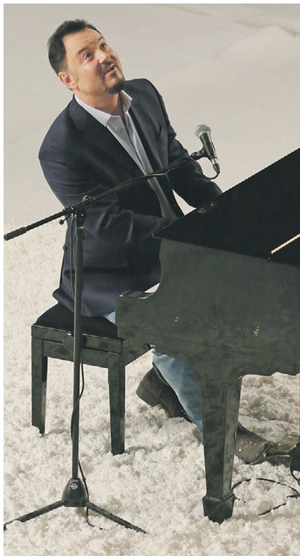
18 ноября 2013 года. Максим Леонидов на съемках клипа группы «Секрет»