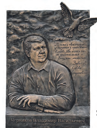
Памятная доска Владимиру Черникову