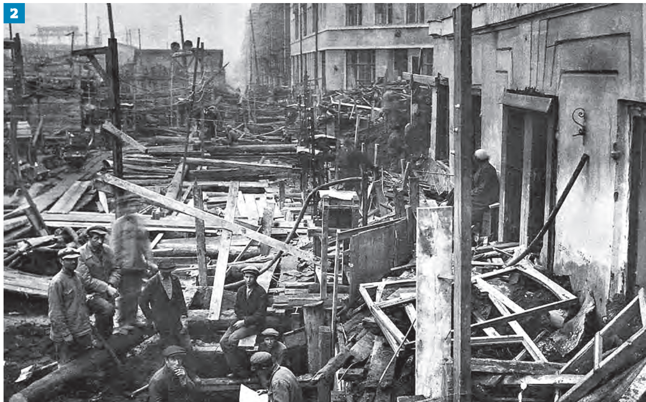
25 февраля 1936 года. Рабочий оформляет потолок вестибюля станции Московского метрополитена (1) Столичные улицы во время строительства метрополитена. 1932–1934 годы (2)

маютка для молока из черной глины и узкогорлые пузырьки. Встретилась маленькая чашечка из гли-