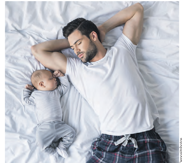
Обычно у тех, кто любит долго спать, рождаются дети с такой же привычкой