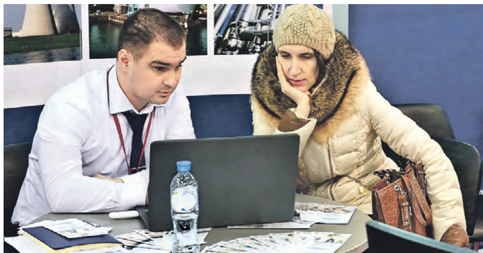
10 февраля 2018 года. Сотрудник банка и посетитель обсуждают покупку жилья

— Паспорт финансового продукта — это крайне важная вещь, и всем нам будет большая польза, если этот инструмент создадут, — убежден финан-