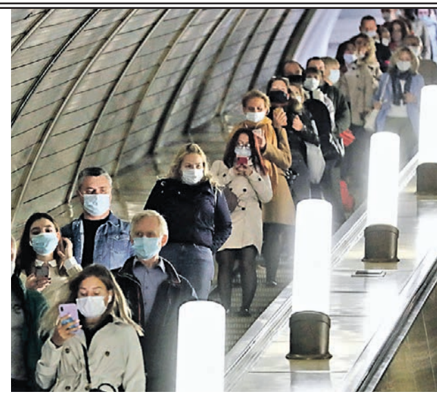
Лучший участник озвучит аудиосообщения на эскалаторах и в вагонах метро