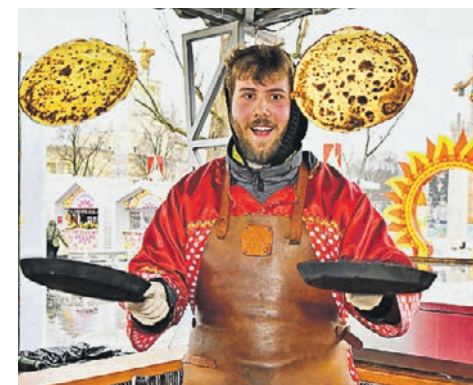
Агентство городских новостей «Москва»

В честь начала Масленичной недели кремлевский повар рассказал «Вечерке», какие блины любили советские правители.