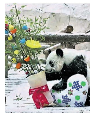
8 марта 2021 года. Панда Диндин оценивает букет, подаренный Жуи

Подушки Диндин оценила сразу, а вот открытка ее не очень заинтересовала — пища духовной панда явно предпочла пищу насущную.