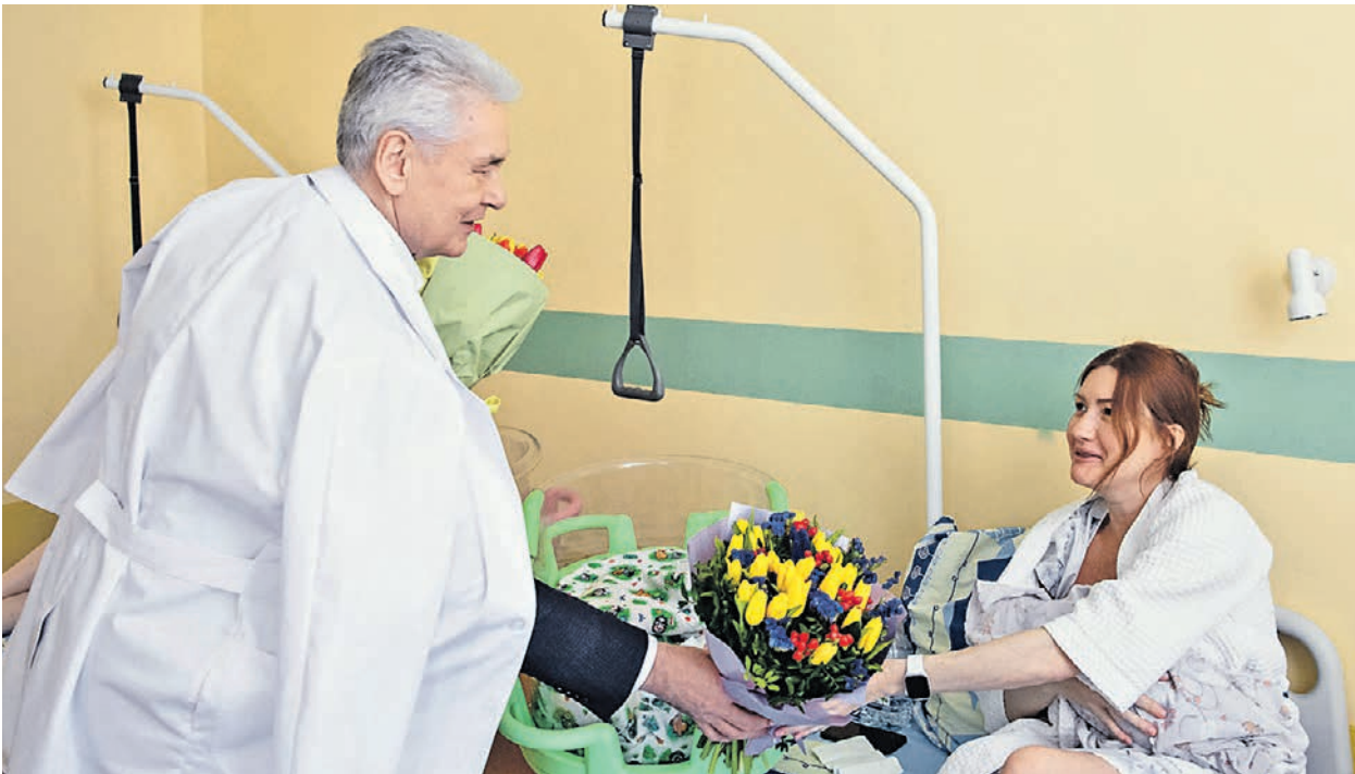
Максим Мишин/пресс-служба мэрии и правительства Москвы