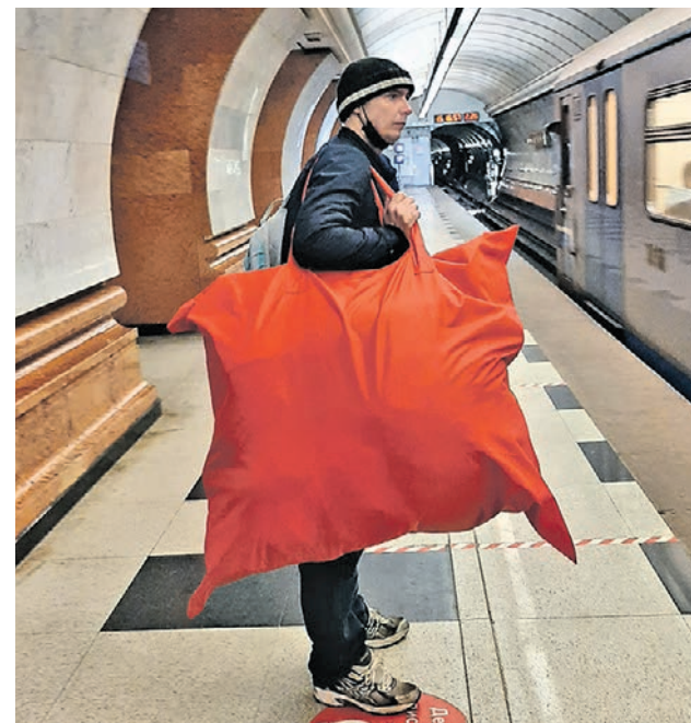
Фото прислал в редакцию читатель, который решил не называть свое имя. Пассажира он встретил на станции «Парк Победы». Так должны выглядеть те самые безразмерные сумки из различных фантастических фильмов и книг.

Случайный пассажир Жизнь в метро кипит с раннего утра до глубокой ночи. Запечатлеть один миг, сюжет или случай в подземке мы решили в нашей специальной рубрике.