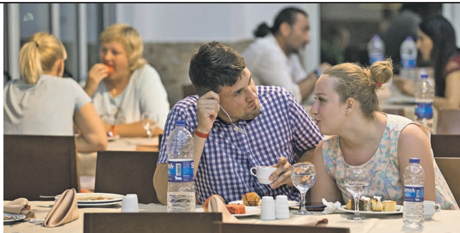
Отдыхающие в ресторане отеля в турецком городе Кемер

Кстати, по оценкам экспертов, на черноморских курортах доля отелей таких форматов достигает уже 15–20 процентов. Большинство из них находятся в Анапе, поскольку этот курорт востребован у семей с детьми. В Сочи, Геленджике и Крыму данных объектов размещения куда меньше. Коммерческий директор порталов по бронированию