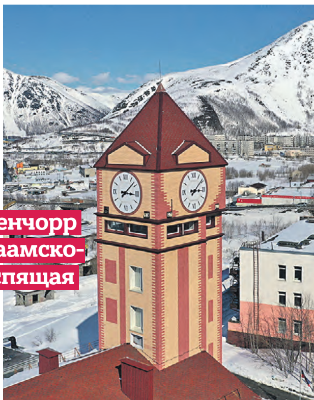
Башня с часами в музейно-выставочном центре «Апатит» — одна из достопримечательностей Кировска