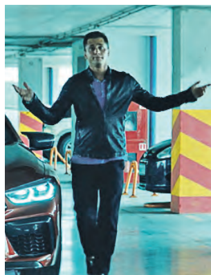
Павел Прилучный в фильме «Мажор возвращается»

Уже в новом году, 1 января, в 21:45, на Первом канале вас ждет премьера полнометражной картины «Мажор возвращается» с Павлом Прилучным. Фильм «зайдет» и поклонникам