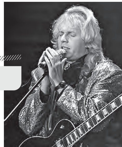
1990 год. Крис Кельми выступил на концерте в «Олимпийском»