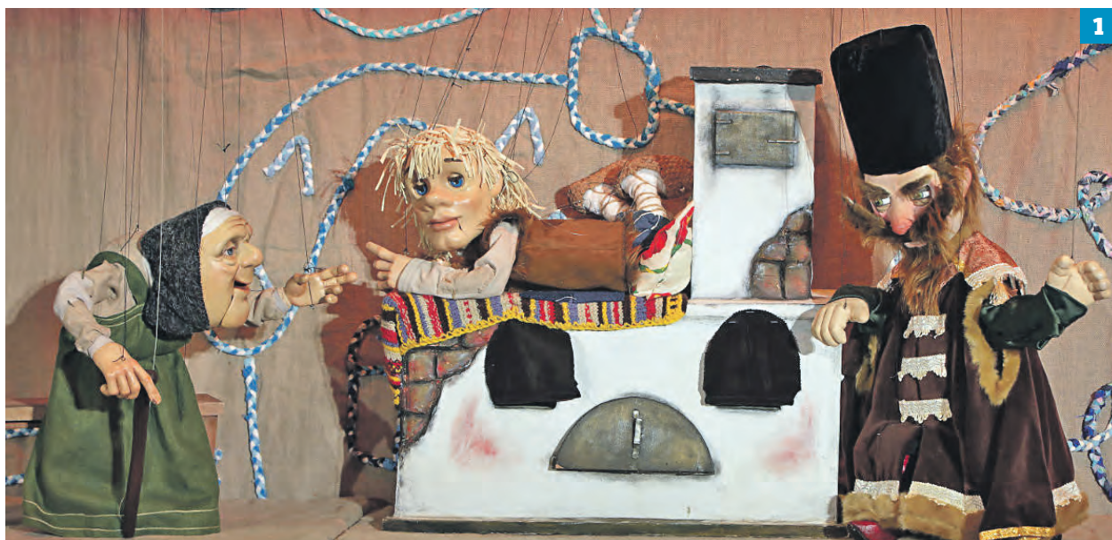
Московский детский театр марионеток