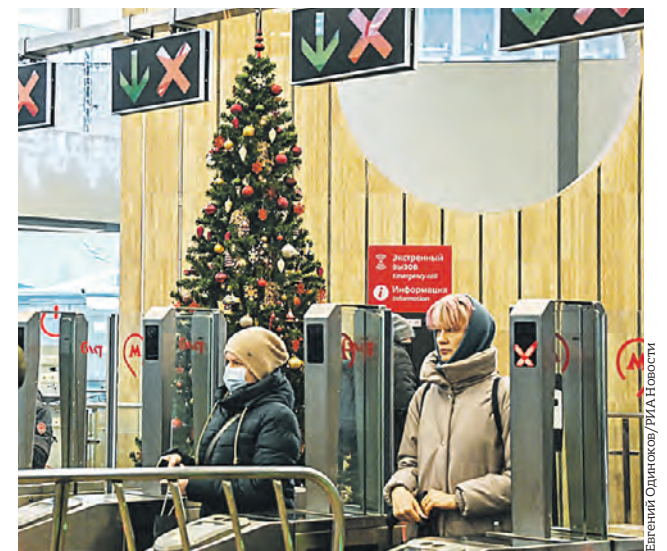
Пассажиры на фоне елки, которой украсили одну из станций Московского центрального кольца

с украшенными елями и чашами. А в вестибюле «Делового центра» на Московском центральном кольце рядом с елкой «живут» теперь снеговика и олени. Их фигуры с удовольствием фотографируют пассажиры. — Праздничные композиции и символы наступающего года — белоснежные зайцы — украсили станции Московского центрального кольца и диаметров, — сообщили в пресс-службе Московской железной дороги. Василиса Чернявская vecher@vm.ru