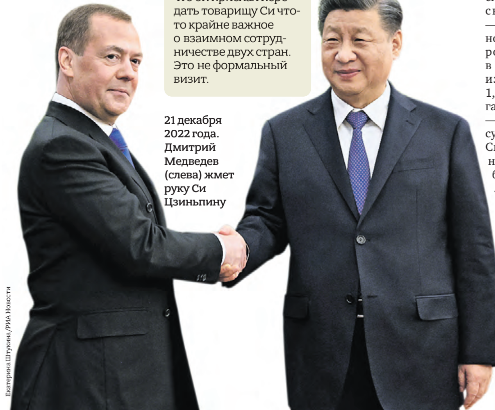
21 декабря 2022 года. Дмитрий Медведев (слева) жмет руку Си Цзиньпину