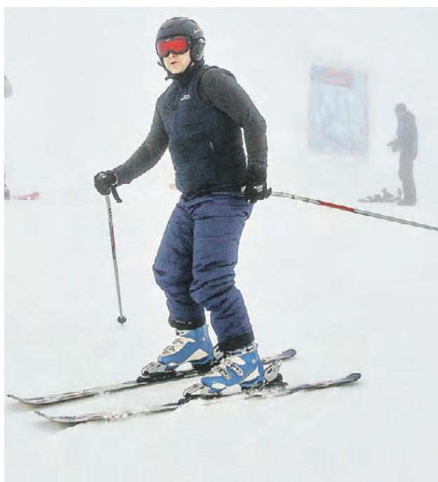
Турист катается на северном склоне горнолыжного комплекса «Большой Вудъявр» в Кировске

лавинной службы. Нужно быть готовым к тому, что, приехав на пять дней, вы сможете провести на склоне только два, потому что все остальное время подъемники могут быть закрыты по причине сильного ветра. В городе несколько гостиниц, но туристы традиционно предпочитают селиться в квартирах. Основные достопримечательности Кировска — в шаговой доступности. Работают здесь и местные службы такси, причем за поездку по городу вряд ли возьмут больше 200 рублей.