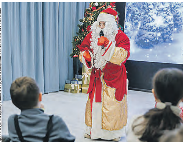
Дед Мороз поздравляет детей участников спецоперации в Центре поддержки в Береговом проезде