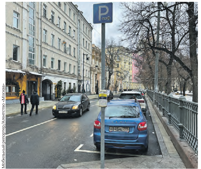
22 декабря. Одна из парковок в центре. В праздничные дни платными будут только парковки со шлагбаумом