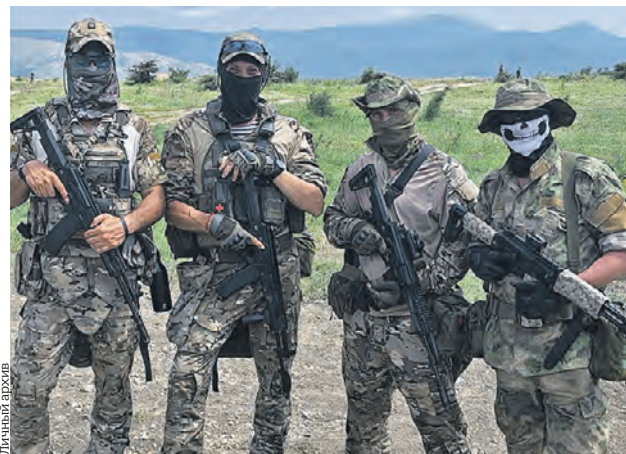
Боец с позывным «Волна» (второй слева) вместе с сослуживцами в зоне спецоперации