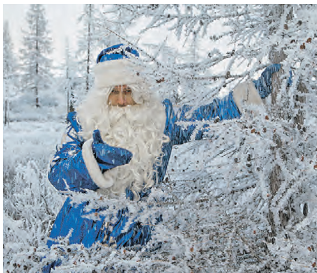
В рамках экскурсии «К Деду Морозу в сказочный лес» участникам предстоит пройти увлекательный квест

и колдуна. Прогулка рассчитана на три часа. Стоимость билета: 1100 рублей за ребенка и 1300 — за взрослого. ■ «Рождество вокруг света» с Часовщиком. Прогулка в необычной компании по центру города займет один час. За это время вы узнаете старинные рождественские и новогодние традиции, а также вспомните любимые песни, связанные с зимой. Стоимость билета: 1200 рублей — детский, 2200 — взрослый.